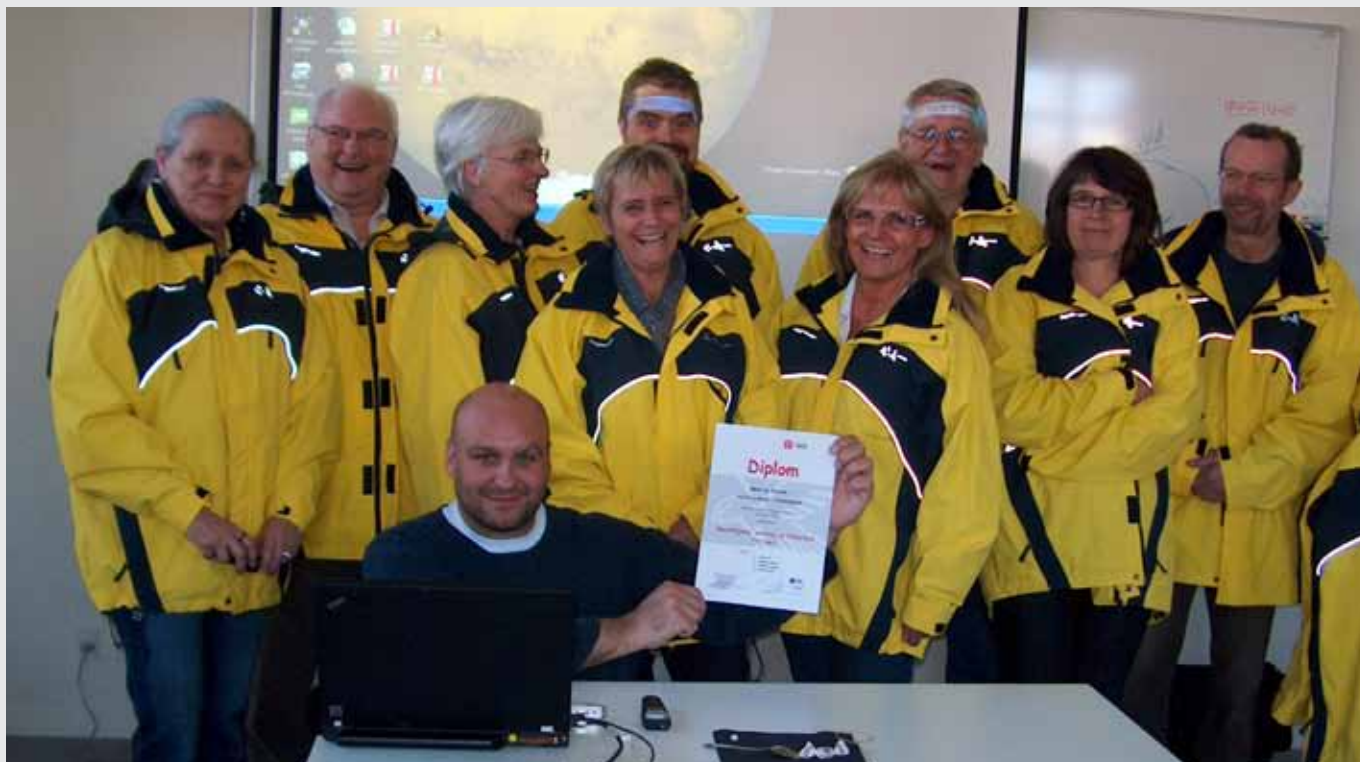
Et udsnit af kursusedtagere fra Natteravnene i Brøndby Strand, Vallensbæk og Ishøj. I midten en af vore dejlige undervisere fra Falck i Næstved, der holdt et inspirerende foredrag og veloplagt besvarede enhver form for spørgsmål fra de ivrige deltagere.

DSB gør meget for sikkerheden i S-togene. De har hyret vagter fra Security