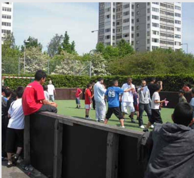
Fodboldbanen, søndag kl. 14.00. Den nye fodboldliga mellem boligafdelinger spiller om en vandrepokal. Skal Brøndby Strands Løver mon aflevere den?