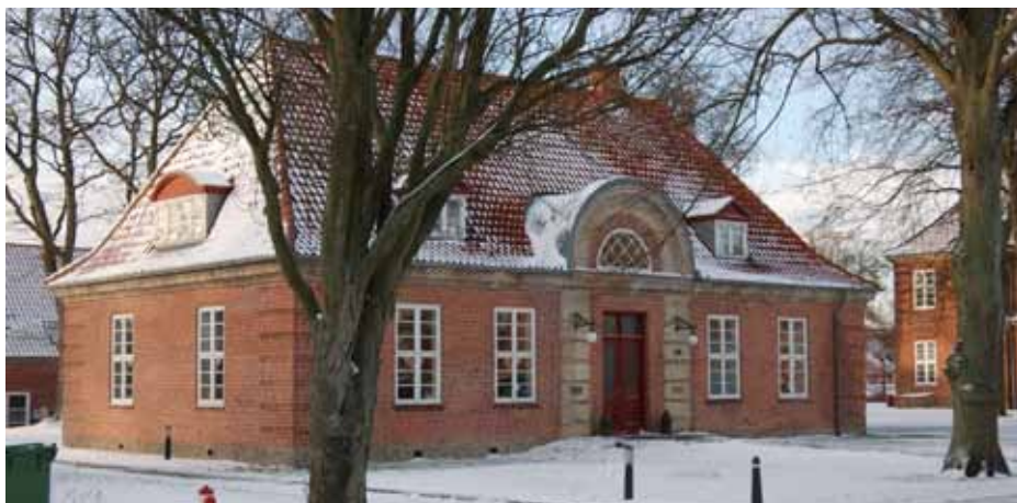
Historiens Hus, Avedøre

Et eksempel på et projekt på tværs af de to kommunegrænser er fejringen af 50 års jubilæet for Danmarks største gennemførte byplan, nemlig Køge Bugt-planen, der var en del af Finger-