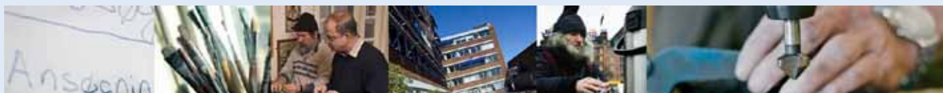
Kofoeds Skole fortæller gerne om det arbejde, der udføres. Men elevernes privatliv respekteres, og derfor kan man ikke fotografere. Denne fotomontage er fra skolens hjemmeside.