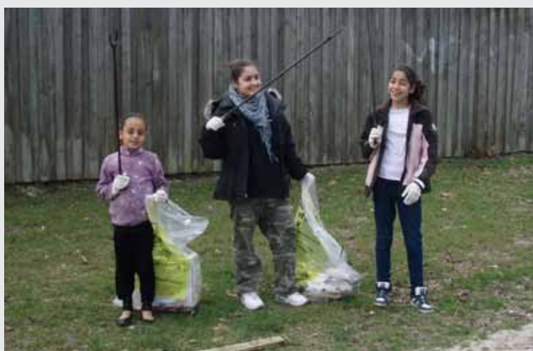
Vil du have en gratis is? Så kom hen på NetværksKontorets telt i Børnehjørnet. Du får isen, når du har samlet en sæk affald. I Børnehjørnet er der blandt andet også karrusel og hoppeborg.

Se de mange andre tilbud i programmet til KulturWeekend, der husstandsomdeles omkring pinse. Det kan også fås på NetværksKontoret, i kulturhuset Brønden, på biblioteker og i aktivitetshusene, samt ses på www.broendbynettet.dk /Kulturweekend .