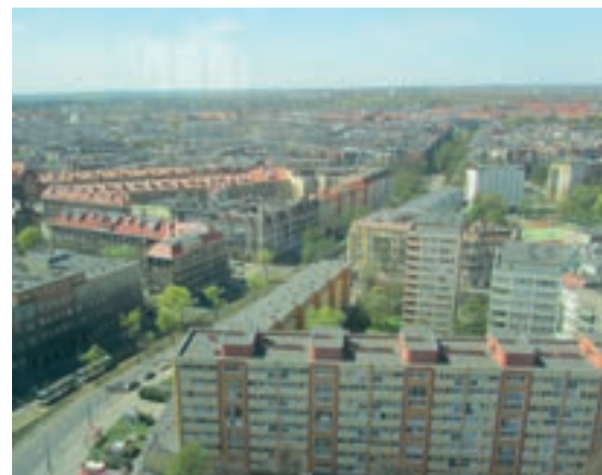
Udsigt over Stettin