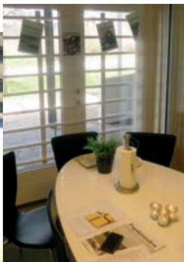
Esplanadens nye lokaler i Mediehuset

Jeg har valgt at blive frivillig journalist på Esplanaden, fordi jeg synes at det var en super god mulighed for at få lov at få noget erfaring med at skrive artikler og lave interviews. Samtidig har jeg fået en på opleveren, ved at komme ud og møde nogle spændende mennesker. Jeg har altid gerne ville være journalist, og jeg synes at arbejdet på Esplanaden har været skægt og udfordrende, i de nu fire måneder jeg har skrevet for bladet.