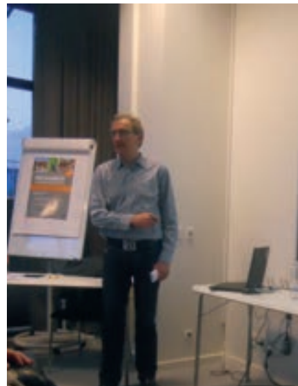
Der var flere oplægsholdere til mødet

Også Brøndby Strand Centret blev bragt på banen, og der var stor enighed om, at det havde set bedre dage, og folk undrede sig over, hvem der mon er ansvarlig for centrets vedligeholdelse? Hertil blev der svaret, at da centeret er privatejet, kan der ikke gøres så meget kommunalt. Men kommunen har naturligvis været, og er, i dialog med de ansvarlige, hvilket dog er lidt af en opgave, da centeret har 3 forskellige ejere.