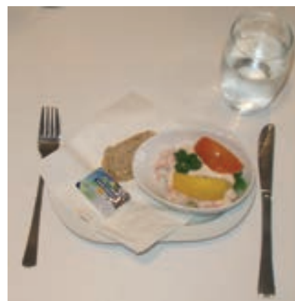
Den lækre rejecocktail, der udgjorde forretten.

Café 13 er et meget afslappet sted at komme, og der forgår en masse ting lige fra smørrebrødsskole til brunch med håndlæsning, og næsten alt derimellem, for eksempel serverer de en skøn frokostbuffet 4 dage om ugen til 35 kr. inkl. Isvand. Og så er der altid søde mennesker – både i køkkenet og baren. Læs mere om stedets arrangementer her i bladet på side 12 & 13, eller husk Café 13's eget blad, næste gang du er der.