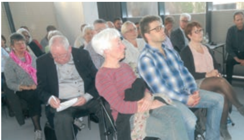
Deltagerne lyttede opmærksomt til kommunalbestyrelsesrepræsentanterne

Her kan du læse mere om dialogmøderne: www.brondby.dk/Kommunen/Okonomi/Dialogmøde