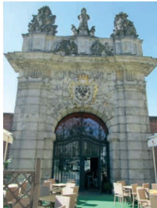
Byport i Stettin