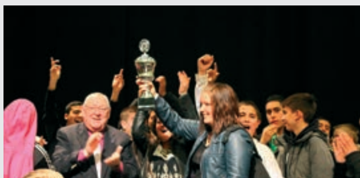
Repræsentant for den klasse der vandt Demokratidagen 2012