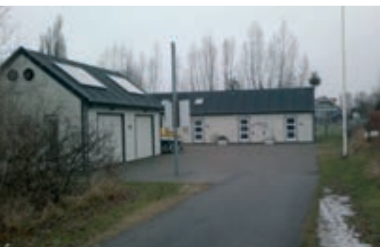
Sejlerhuset set ude fra vejen. Husets stue.

Foruden sejlsport og aktiviteter med børn og voksne består meget af Axels daglige arbejde uden for sæsonen af at vedligeholde klubbens område og at bygge nye spændende ting til brug for de unge. Det drejer sig f.eks. om at finde materialer til færdiggørelse af cykelstativer, fikse fiskenettet på stedets trampolin og reparere et gigantisk – nu væltet – pavillontelt. Der er også et 200 liter stort akvarium og en elbåd, der blot skal sættes i stand – for bare at nævne nogle enkelte ting – alt sammen noget, som Axel har klunset gennem årene.