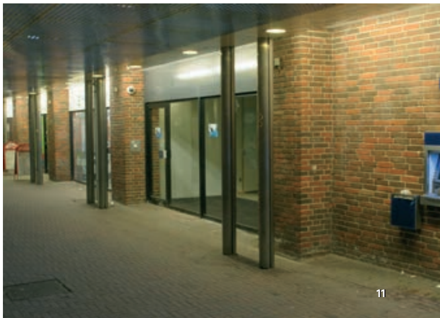
Lokalerne hvor Danske Bank plejede at holde til

Centerforeningen tror på en fremtid for vores center, kunderne er her jo, så det er mulighederne også. Vi har hele 4 dagligvarebutikker, som jo er med til at trække kunder til centret dagligt. I USA, som er banebrydende indenfor detailhandel, er tendensen at dagligvarebutikkerne nu placerer sig udenfor de helt store regionscentre i mindre centre og ved indfaldsveje. Det trækker mindre handlende med, herunder forskellige udvalgsvarebutikker som eksempelvis tøj og sko. Da vi allerede har rigeligt med dagligvarebutikker i centret, er det vores tro at når finanskrisen lægger sig vil vi kunne tiltrække flere udvalgsvarebutikker til centret. Det vil styrke hele handlen i centret.