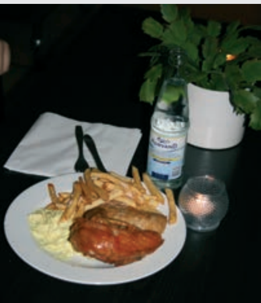
Kylling med fritter og remoulade - en klassiker