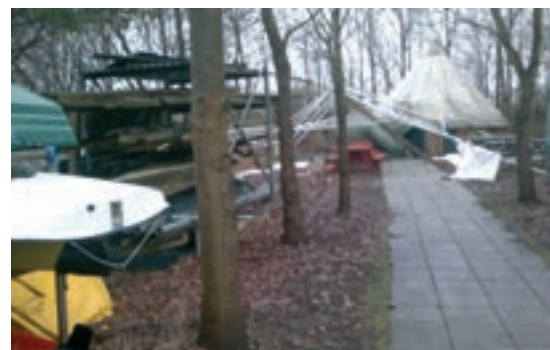
Det bagerste af grundens have, hvor man kan se den væltede teltpavillon.

me herved og hænge ud, så ødelægger de deres egne muligheder. Jeg vil godt vise, at det kan lade sig gøre at have sådan et sted. Vi kan jo ikke bare låse os til sikkerhed. For mig er det noget med at få kontakten til unge mennesker og sige; 'Ring ned og sig, at I vil være fysiske!'" fortæller han. Et par timer senere er de knækkede teltstænger dog fjernet og området ryddet, så der kan komme noget nyt og forhåbentligt mere solidt, op.