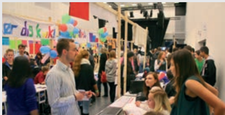
Eleverne fortæller om deres projekt til de interesserede

Her bliver et af projekterne præsenteret for dommerpanelet