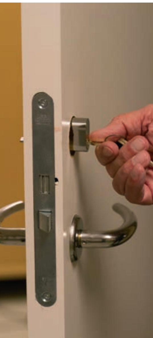
Døren til Mediehuset er nu klar til at blive åbnet.