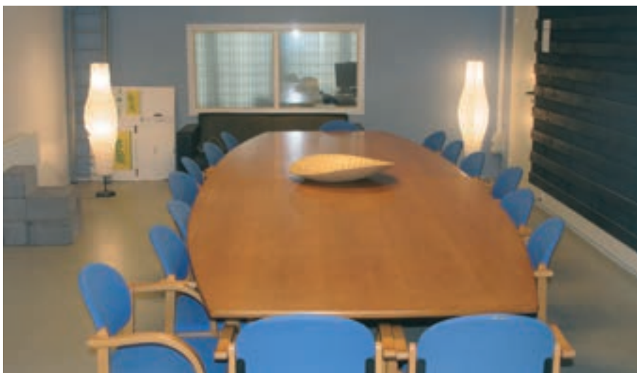
Mediehusets flotte mødelokale, hvor blandt andet fotoklubben samles hver onsdag.