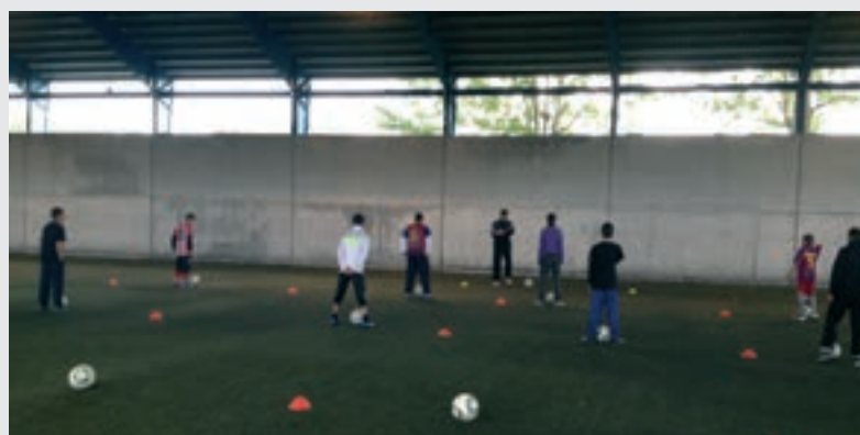
Nu er de tid til at vise, hvad de har lært.

Oplevelsesbanken er en organisation som samarbejder med forskellige store virksomheder og organisationer om at give gode oplevelser til børn. Arrangementerne er for børn, som ellers ikke ville få den slags oplevelser. Eksempler på samarbejdspartnere er Anemone Teatret og Cirkus Dannebrog.