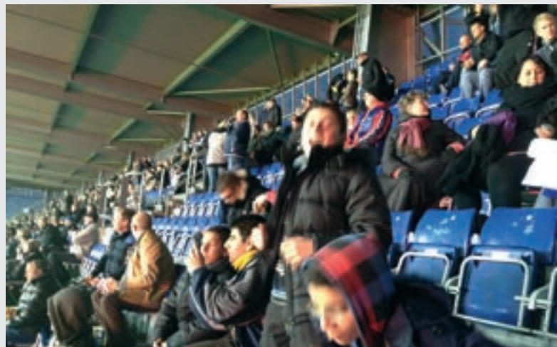
Kampen mellem Brøndby IF og AAB er i fuld gang, og der heppes.

Oplevelsesbanken er en organisation som samarbejder med forskellige store virksomheder og organisationer om at give gode oplevelser til børn. Arrangementerne er for børn, som ellers ikke ville få den slags oplevelser. Eksempler på samarbejdspartnere er Anemone Teatret og Cirkus Dannebrog.