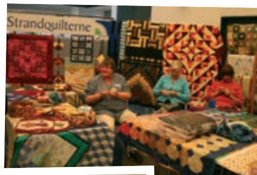
Foreningen Strandquilterne lyste lokalet flot op med deres kulørte kreationer.