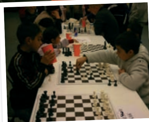
Brøndby Strand Skole havde linet op med skakspil til stor underholdning for mange børn.