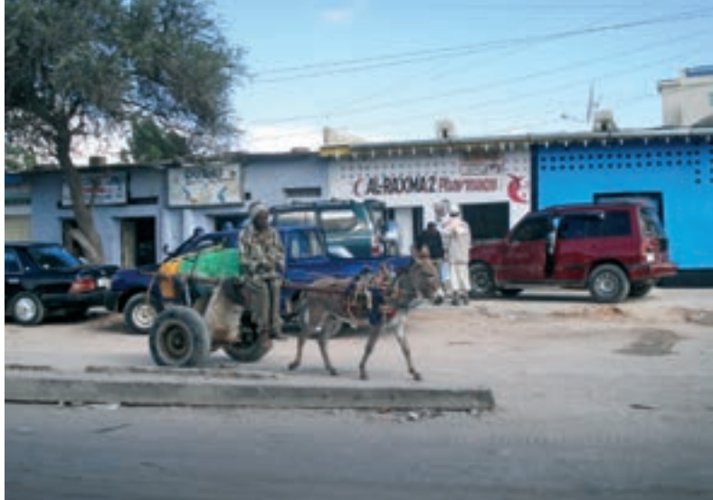
En vandsælger med sit æsel. Når æslet er for gammelt til at trække, slippes det fri og går rundt i gaderne og spiser affald til det dør