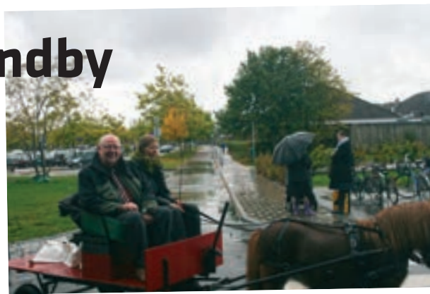
Borgmesteren fik sig en tur i hestevognene fra Søholtgård.

Og fodbold fik man! Der blev kæmpet "til den sidste blodsdråbe", og holdene gled rundt mellem hinanden. De skred i vandet, så det var lige før der kom bobølger. Det allermest bemærkelsesværdige var, at selvom store, våde dråber stod ned i stænger, og alle var våde fra yderst til inderst, havde alle et smil på læben og solskin i øjnene.