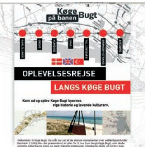
Hjemmesidens forside - kig endelig forbi!

Der var en del borgere, som var mødt op i Portalen for at høre om det nye tiltag, og de var alle begejstrede for projektet. "Det er et rigtig godt initiativ, jeg skal direkte ind på hjemmesiden når jeg kommer hjem", sagde en lokal Greveborger, som også er medlem af Greve Lokalhistorisk Forening.