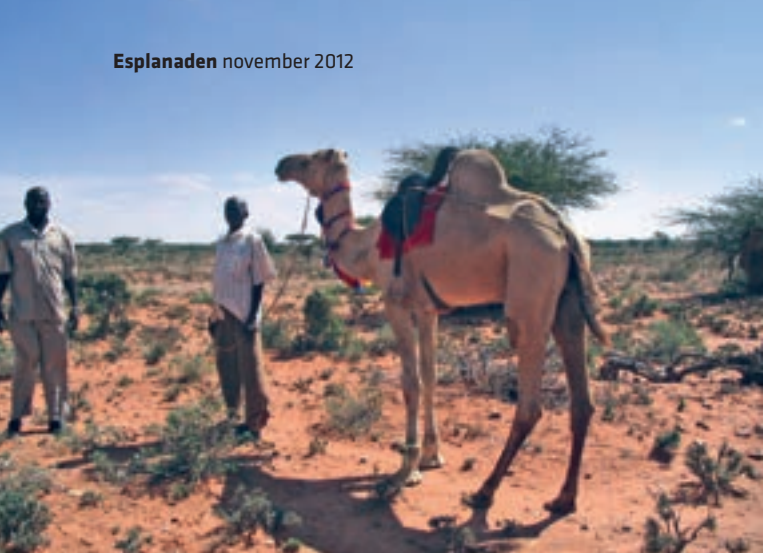
Normaderne fra Reer Bari har pyntet en af deres kameler for gæsterne.