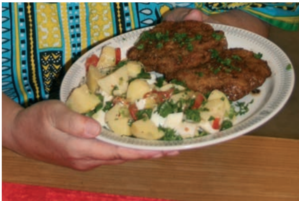
Dagens ret – Krebinetter med kold tyrkisk kartoffelsalat.

tere, og masser af arbejde. De står gerne for at holde fester, så fødselsdage, bryllupper, konfirmationer og lignende er meget velkomne, men kun fredag og lørdag aften, hvor selskaber kan være alene i lokaliteterne.