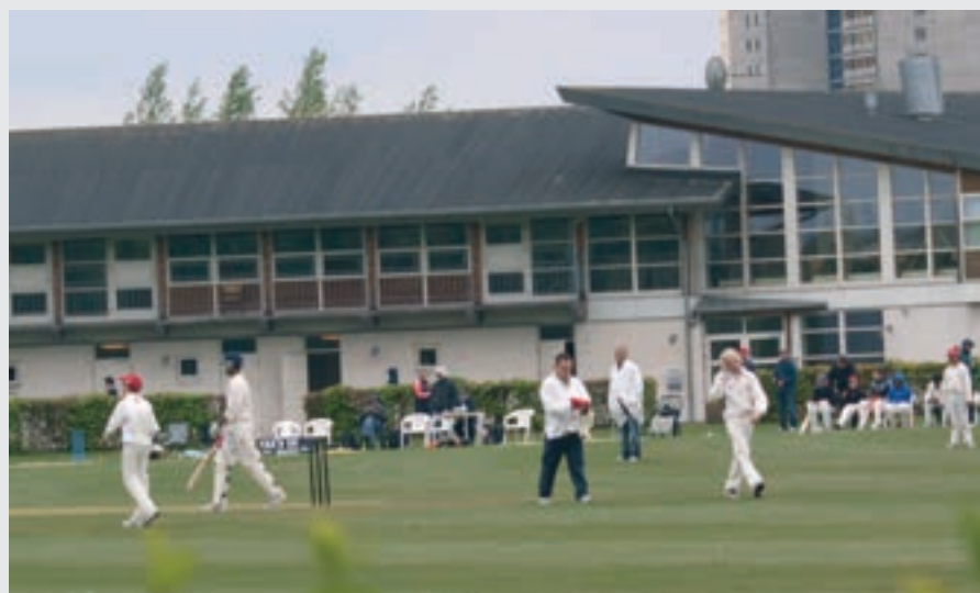
Danmark U-14 mod Schweiz U-14 i begyndelsen af maj 2012 på Svanholm Park.