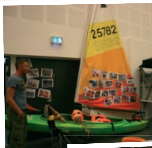
Sejlerhuset i Brøndby Strand riggede til med sejlerudstyr til den store gulmedalje.