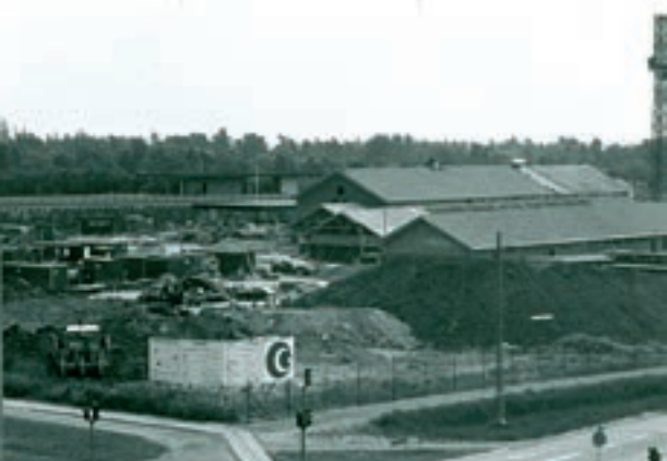
Greve centret er vokset af flere omgange - find ud af mere om Greves udvikling på hjemmesiden, eller tag en byvandring med din smartphone i hånden.

Hjemmesiden findes på nuværende tidspunkt både på dansk og tyrkisk. Snart vil siden også kunne vises på engelsk.