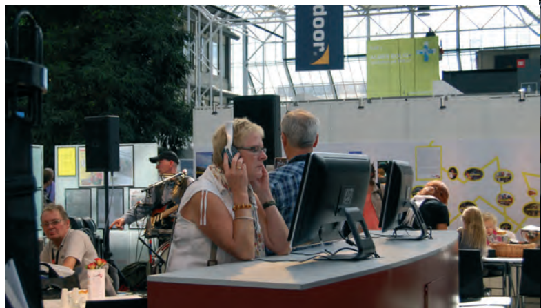
Der bliver set videoklip om aktiviteterne i 13-Huset