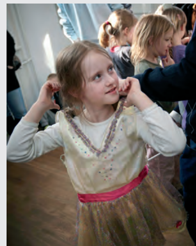
Kommende cirkusprinsesse hygger sig i det kreative værksted