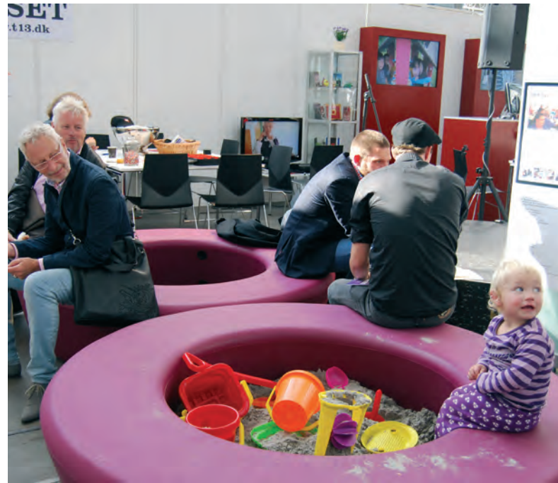
Sandkassen var populær blandt både store og små

den hyggelige café. Messedeltagerne fik pulsen lidt i vejret, samtidig med at de kunne nyde en kold fadøl. I den forbindelse kunne de vinde en kasket med Café 13 logoet på, hvis de besejrede de ellers kompetente praktikanter, Nana og Nanna, fra NetværksKontoret. Efterfølgende havde de mulighed for at tage plads ved et af cafébordene, og sunde sig ovenpå kampen med en kop kaffe og et stykke kage.