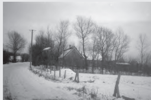
Maglebro, da der endnu var åbent land

Længere oppe ad Monsunvej mod Køgevejen lå Monsunen. Det var et sommer-