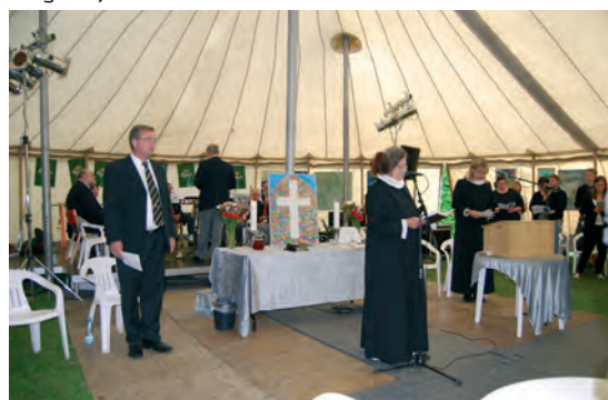
Fra gudstjenesten i teltet under KulturWeekend