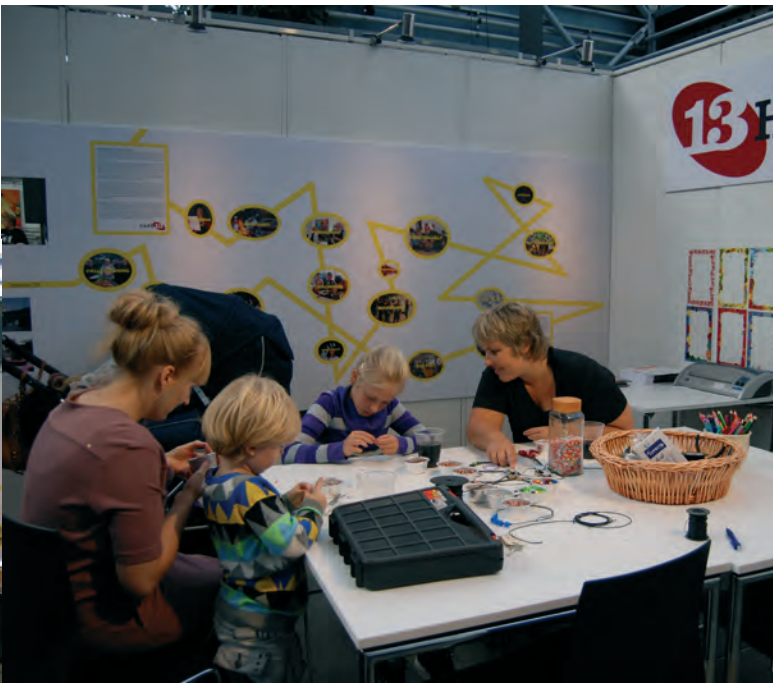
Hygge og leg med perler i børnehjørnet