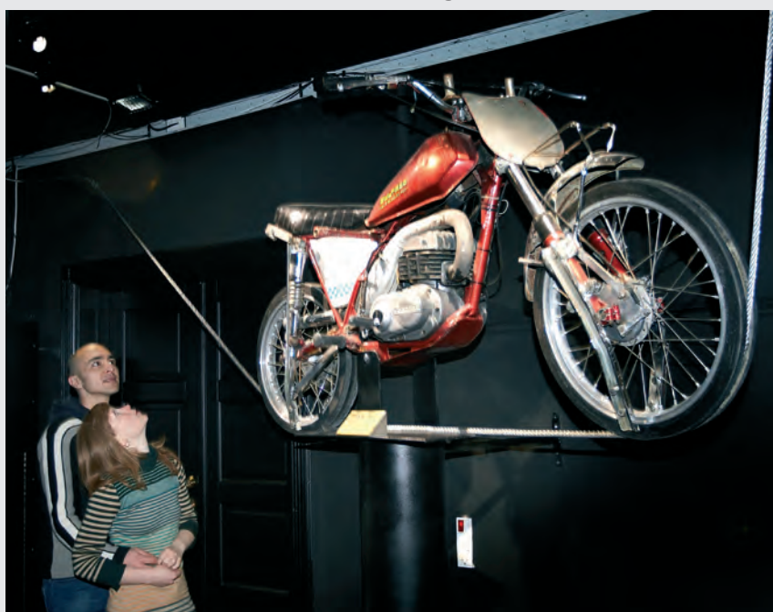
Forundret publikum funderer over hvad motorcyklen laver på linen