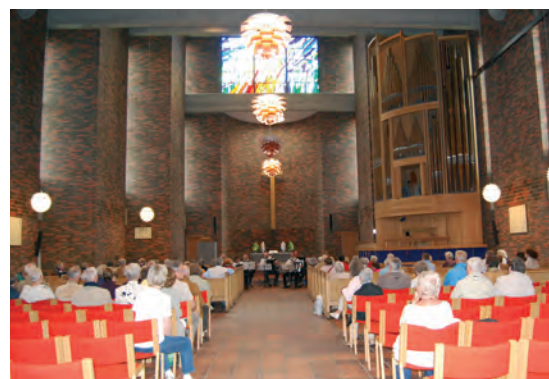
Afslutningskoncerten ved KulturWeekend 2009

"Vi vil gerne være i dialog med andre religioner. Men man skal ikke glemme, at der også er en del indvandrere, som er kristne.